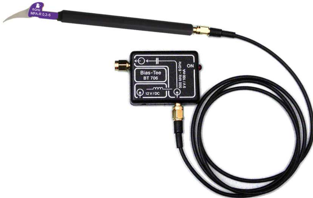
Bias-Tee BT 706 mit Nahfeldmikrosonde MFA-R 0,2-6