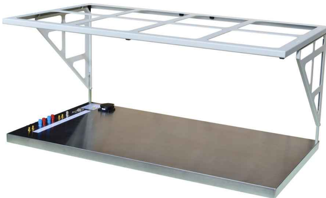
Grundplatte mit Zeltgestänge aufgebaut